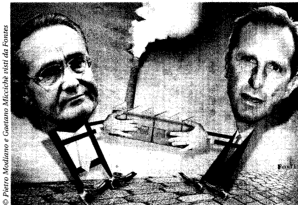
© Pietro Modiano e Gaetano Miccichè visti da Fontes